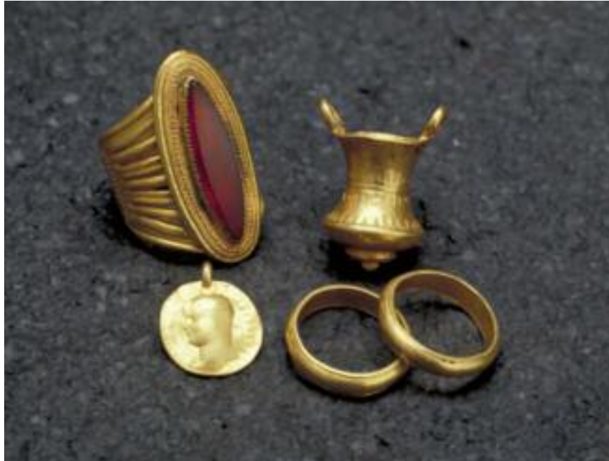
I kammargraven i Fullerö fanns en stor gulfingerring med rödororange karneol omgiven av pärlad guldtråd, dessutom två fingerringar, en korgformig berlock av guld och ett guldmynt präglat av kejsar Maximianus omkring 290 e.Kr. Fullerömannen kan ha burit det i en snodd runt halsen.

ser som följer ån. Men vid Fullerö finns ett undantag: en enda markegendom i Gamla Uppsala socken ligger på andra sidan ån, det är byn Skärna mitt emot Fullerö (se sid. 307).