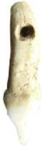
En kotand med hål i låg i offergropen.

innehållit mat som ställts ner i gravarna under åren 800–400 f.Kr., alltså vid samma tid som begravningarna pågått även på Torsberget.