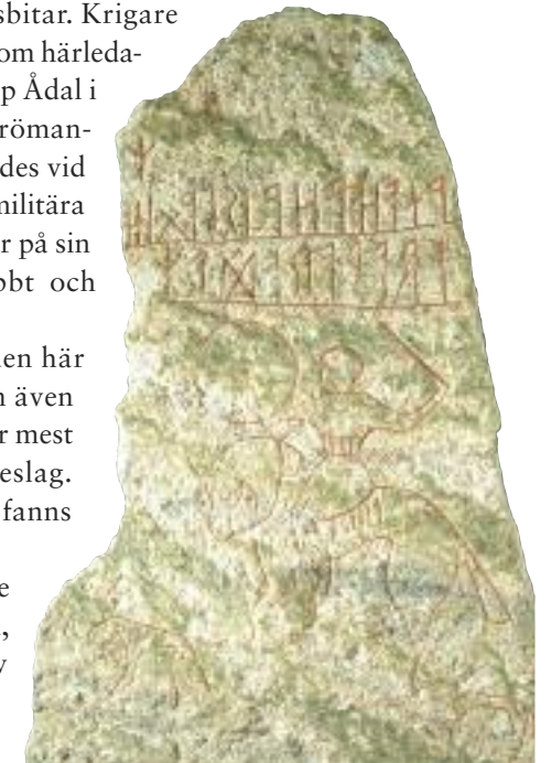
Över två meter hög är bildstenen från Möjbro väster om Uppsala. Ryttaren ristades troligen på 400-talet, och liknar en senromersk kavallerist med aristokratisk hästhållning och i sällskap av två jakthundar. Inskriften är gjord med den äldsta runraden, som användes såväl i Norden som bland germansktalande på kontinenten. Den är svårtydd, men har tolkats som »Fråråd, på hästen, är slaktad/slagen«. Finns i Historiska museets magasin.

Inom forskningen har det funderats en del