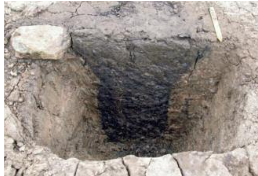
En halv meter vid tjärgrop i Fullerö. Kådrök tallved har packats i den övre delen av gropen och fått brinna långsamt, under låg syretillförsel, så att tjära smält ut och samlats upp i ett kärl av trä eller lera i utrymmet under.

Den äldsta kända framställningen av järn ur bergmalm som man känner till i Norden har också pågått i Fullerö på 100-talet eller 00-talet e.Kr. Upptäckten gjordes vid en mycket liten grävning för en cykelbana intill bilväg 290, redan år 1989. Två bottnar till järnframställningsugnar kom fram då, och i ugnsbottnarna låg bitar av bergmalm tillsammans med slagg som innehöll magnetit av samma sort som malmen. På Fullerö hade man alltså gjort experiment med att utvinna järn ur bergmalm istället för att hämta den ur rödjord. Bara ett par kilometer bort hade ännu en sensationellt tidig järnframställningsplats egendomligt nog upptäckts, i Lyckebo i Storvreta, där en ugn avsedd för myrmalm hade