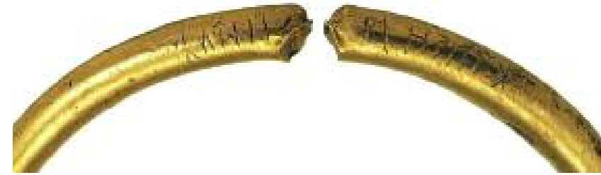
På en halvkilos guldring från Pietroasa i dagens Rumänien finns en gotisk inskrift med runor, som lyder: »Gutani o wi hailag«. Orden »wi« och »hailag« har med helighet att göra så den handlar om en »goternas helgedom«. Nedanför några rader ur Silverbibeln skrivna på det gotiska alfabetet som skapades på 300-talet för att nedteckna goternas bibelöversättning. Raderna är präntade med blått och guldfärg på ett pergament rödfärgat av purpur. Finns i Uppsala universitetsbibliotek.

På 200- och 300-talen talades ett idag utdött språk, gotiska, vid Svarta havet eller åtminstone vid romarrikets gräns, ungefär i dagens Rumänien. En hel del